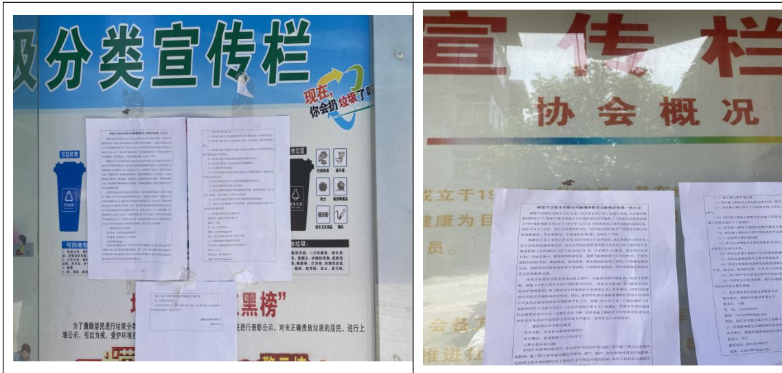
图2 周边村庄第一次公示情况