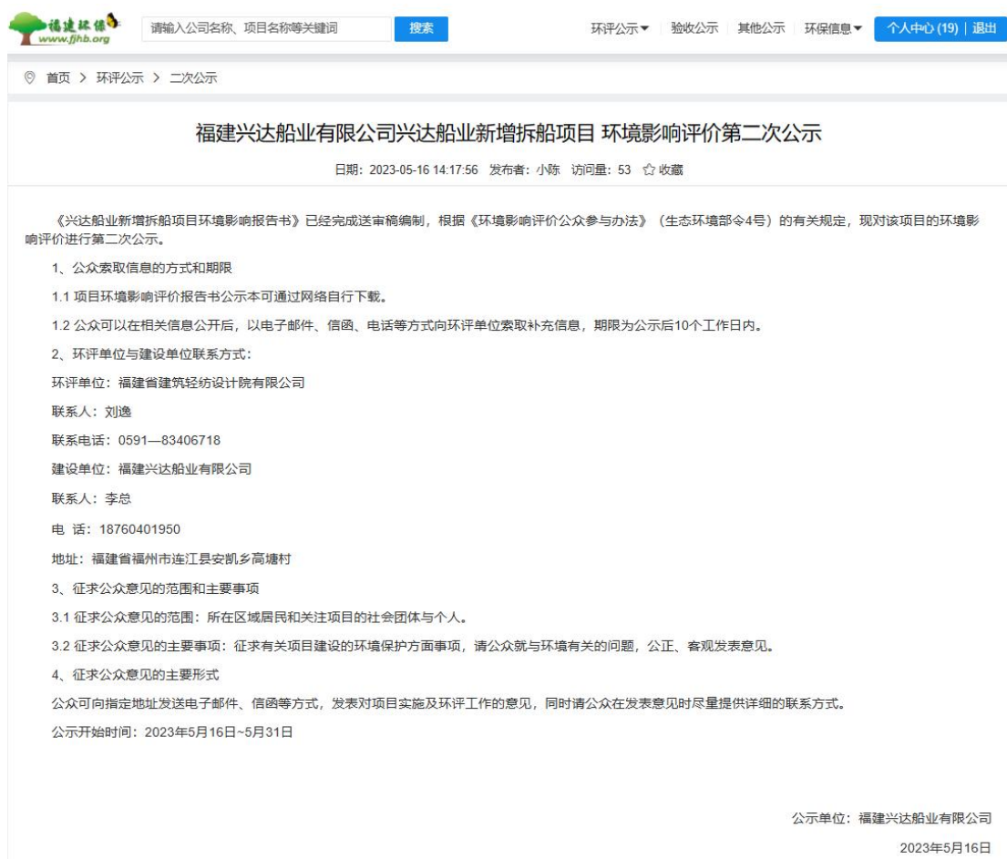
图3 征求意见稿第二次公示截图